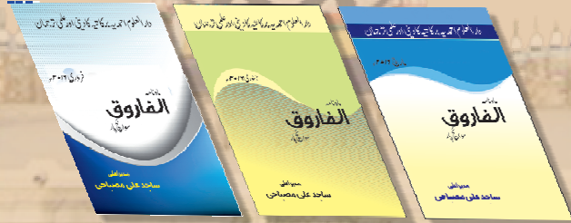
[صورة مقترحة لمكتب مجلة الفاروق]

يود المسئولون عن دارالعلوم الأحمدية البركاتية إصدار مجلة إسلامية شهرية لتبين للناس ما نزل إليهم ولعلهم يتفكرون. ولا يخفى أن إصدار مجلة كهذه يحتاج إلى جماعة كبيرة من العلماء والكتاب كما يحتاج إلى مكتب كبير ينجز فيه جميع الأعمال ذات صلة بالمجلة. وهذه المجلة كما ذكرنا تسمى بمجلة الفاروق نسبة إلى سيدنا عمر بن الخطاب رضي الله تعالى عنه. المتوفى: ٢٤هـ