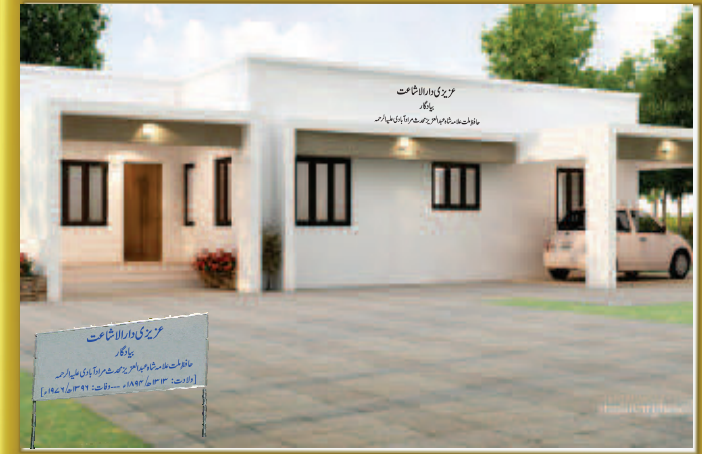
[صورة مقترحة لدار النشر العزيزية]